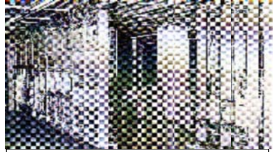
入社の日・D10電子交換機