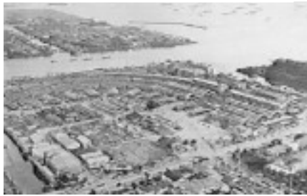
1935年開設 当時の築地市場

管理職も正も非正規も「切捨て」 売却益(約900億円)は設備投資と首切り費用(40億円)に充当。00年の策の繰り返しです。