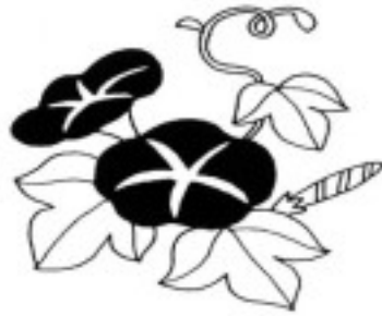
朝顔の花言葉：愛情の絆

東京都港区三田3-2-20 TEL 03-3455-6006 http://oakhp02.chottu.net