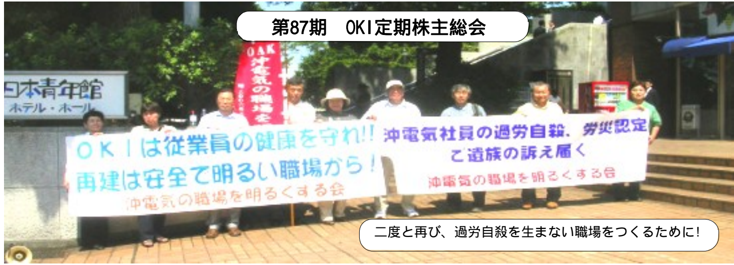
第87期 OKI定期株主総会

「会」は沖電気とその関連などで働く人々が「安心して人間らしく働ける職場」を願って創られました。正規・非正規を問わず誰でも入会できます。略称はOAKです。 仕事や生活のこと、世の中の事を一緒に考えてみませんか。少しでも明るい明日になるようにと、会紙は「あすなろ」 《設立 1986年》