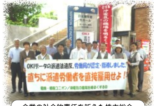
企業の社会的責任を訴えた株主総会

回答：継続的安定的に配当をできる体制が十分に整っておりませんので配当は見送らせていただきました。中期経営計画を達成した上で、実施できるよう努力する。優先株主には今期13.2億円、12年度は10.3億円の配当予定。