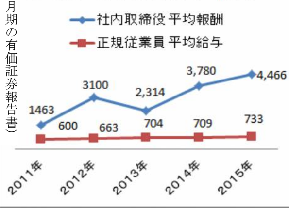
沖電気の年間・給与・報酬 (万円)

65歳以上が3296万人で人口比26%になった日本(2014年9月15日現在)。「号泣裁判」「絶望の介護殺人」などの報道が頻繁です。施設介護、在宅介護、介護者支援の在り方の3本柱の取組みの遅れ・不十分が生み出している殺人と言えます。「私だつて……」と身近な問題となっています。 介護殺人Ⅱ被害者60歳以上、親族による殺害事件。