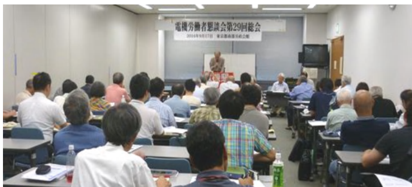
電機労働者懇談会第29回総会

の生活を楽しく送って欲しい。 頼むと安心して愛犬を預けることができる。そのペットシッターは保健所への登録が義務付けられている。歳を取ってもいろいろな人の助けを借りてペットとの生活を楽しく送って欲しい。